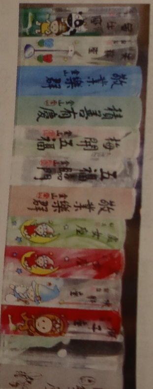
Tampons en plastique avec des motifs pour enfants.

La première chose à déterminer est la composition du sceau. Les Taïwanais utilisent trois caractères : celui du nom et les deux du prénom. Parfois ils ajoutent un quatrième, [ɲ] prononcé yin carré, l'équilibre est meilleur, et la composition est facilitée, chaque caractère chinois étant circonscrit lui-même dans un carré. Pour se faire un tampon il suffit de faire traduire en chinois votre nom et prénom... ce sera approximatif. Par exemple, le r n'existe pas en chinois !!!