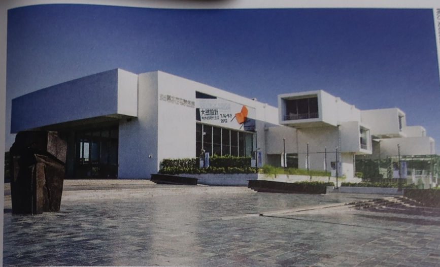
Musée des Beaux-Arts de Taipei.

près de 17 t, devant laquelle, toutes les heures, les visiteurs assistent à la relève de la garde. Se tiennent, dans les galeries des étages supérieurs, des expositions permanentes ayant trait à la peinture et à la calligraphie chinoises et des expositions temporaires. Enfin, la salle des documents historiques du docteur Sun Yat-sen retrace l'histoire du révolutionnaire à travers manuscrits, photos et dossiers. La figure de Sun Yat-sen étant aussi importante que celle de Tchang Kaï-chek, les informations ici exposées relèvent de la propagande d'Etat : il ne faut donc pas tout prendre au pied de la lettre. Mais ce sera l'occasion de réviser le cœur de sa doctrine, qui a inspiré la constitution de la République de Chine : « les trois principes du peuple », c'est-à-dire le nationalisme, la démocratie et le bien-être du peuple.