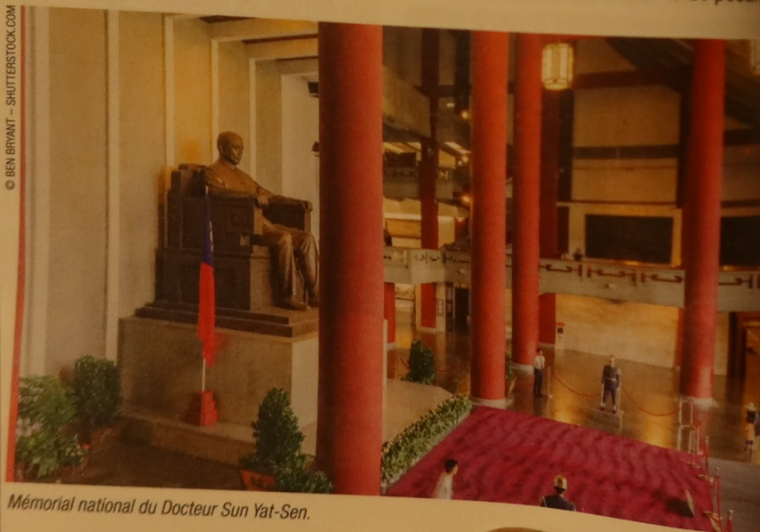
Mémorial national du Docteur Sun Yat-Sen.

505 Section 4, Ren'ai Road, Xinyi District ☎ +886 2 2758 8008 www.yatsen.gov.tw M° Sun Yat-sen Memorial Hall.