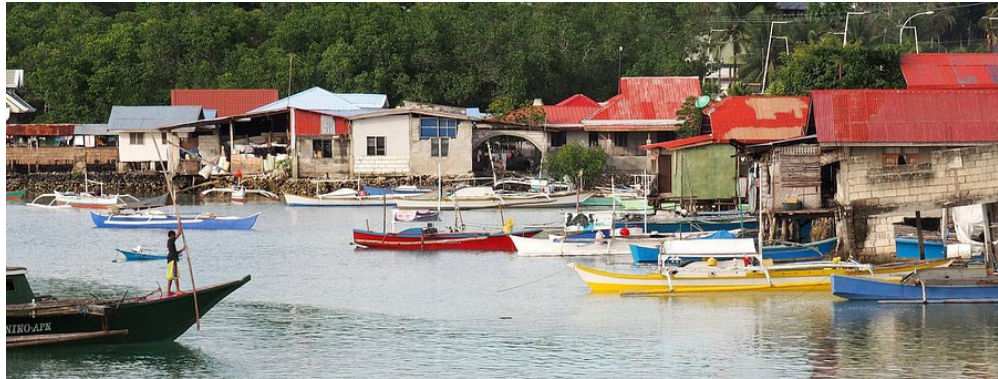
Les meilleures choses à faire à Bohol en 3 jours

Il y a des sanctuaires qui aident les tarsiers, le plus petit mammifère du monde et il y a des îles où vous pouvez nager avec les tortues.