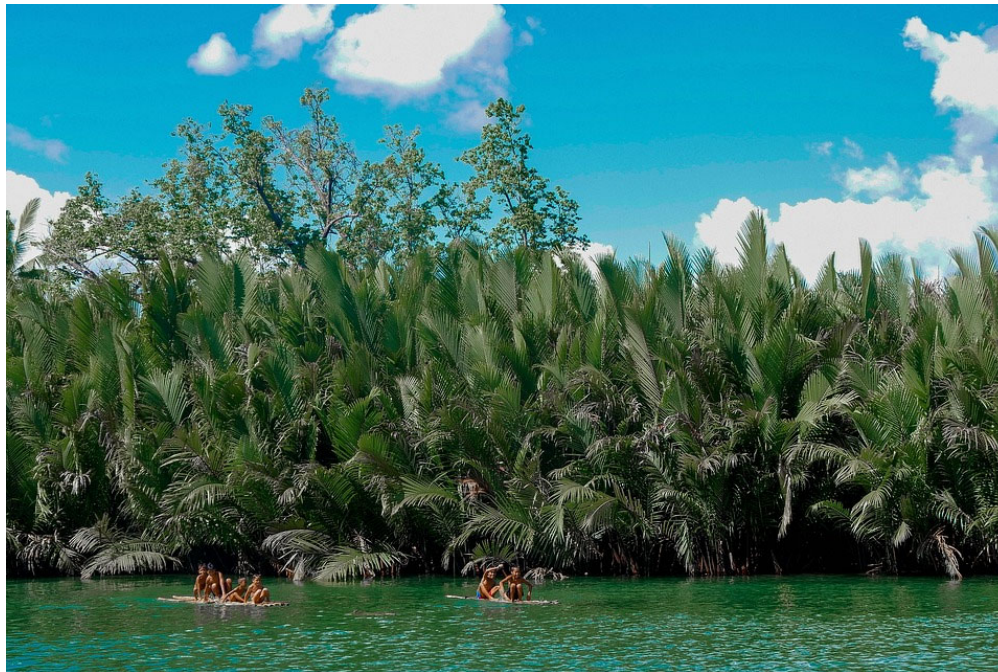
Les meilleures choses à faire à Bohol en 3 jours

Les chutes de Pangas se trouvent à moins de 30 minutes de route. C'est l'endroit idéal pour se baigner le matin, après avoir subi la chaleur de Chocolate Hills.