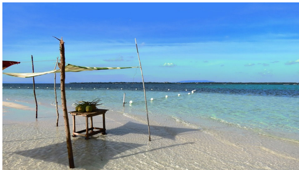
Les meilleures choses à faire à Bohol en 3 jours

Nous allons vous montrer les meilleures choses à faire à Bohol et comment vous pouvez créer votre itinéraire parfait avec seulement 2 ou 3 jours à Bohol.