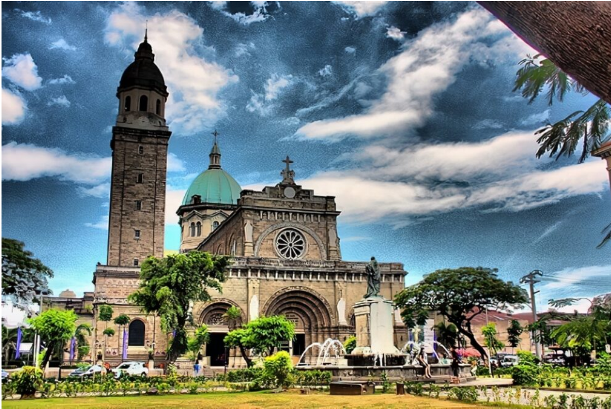
Cathédrale de Manille – Flickr – Frisno Boström

Les Philippines sont le cinquième plus grand pays catholique du monde et il existe un certain nombre de vieilles églises à Manille. Leur architecture, fresques et différents ornements sont d'excellents exemples des différents styles artistiques. Les édifices les plus populaires sont l'Église de Quiapo, l'Église de Baclaran, l'Église Saint-Sébastien, l'Église San Agustin, et la cathédrale de Manille.