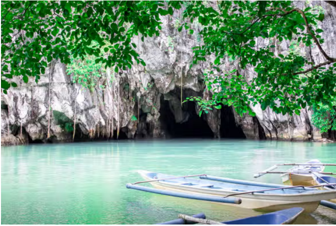
Excursion sur la rivière souterraine de Puerto Princesa

· Annulation gratuite jusqu'à 24 heures à l'avance · Prise en charge à l'hôtel ·