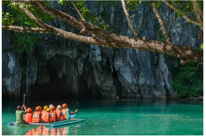
La rivière souterraine

Parcourez la plus longue rivière souterraine navigable du monde ! En naviguant sur ses eaux cristallines, vous découvrirez tous les secrets de cette merveille naturelle de Puerto Princesa.