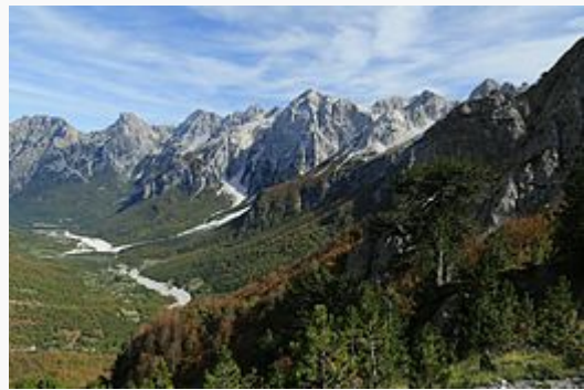
Vallée de la Valbona