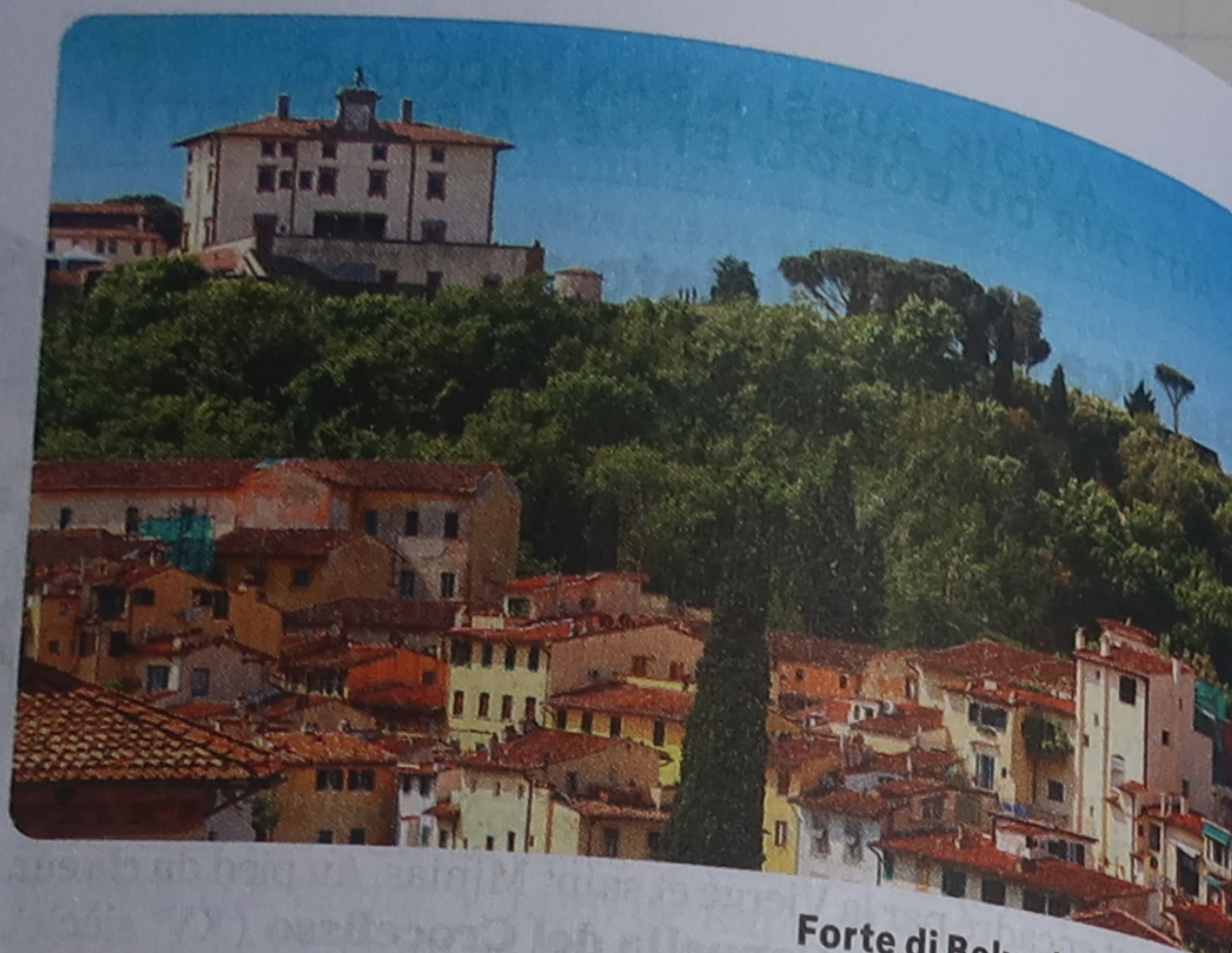
Forte di Belvedere (p. 567)

mettre à l'abri, mais plus des Florentins que d'ennemis externes. De là-haut, la vue sur la ville est en effet imprenable. Le site accueille des expositions d'art en été. Grimpez la Costa San Giorgio pour atteindre l'entrée du fort, sur la Via San Leonardo.