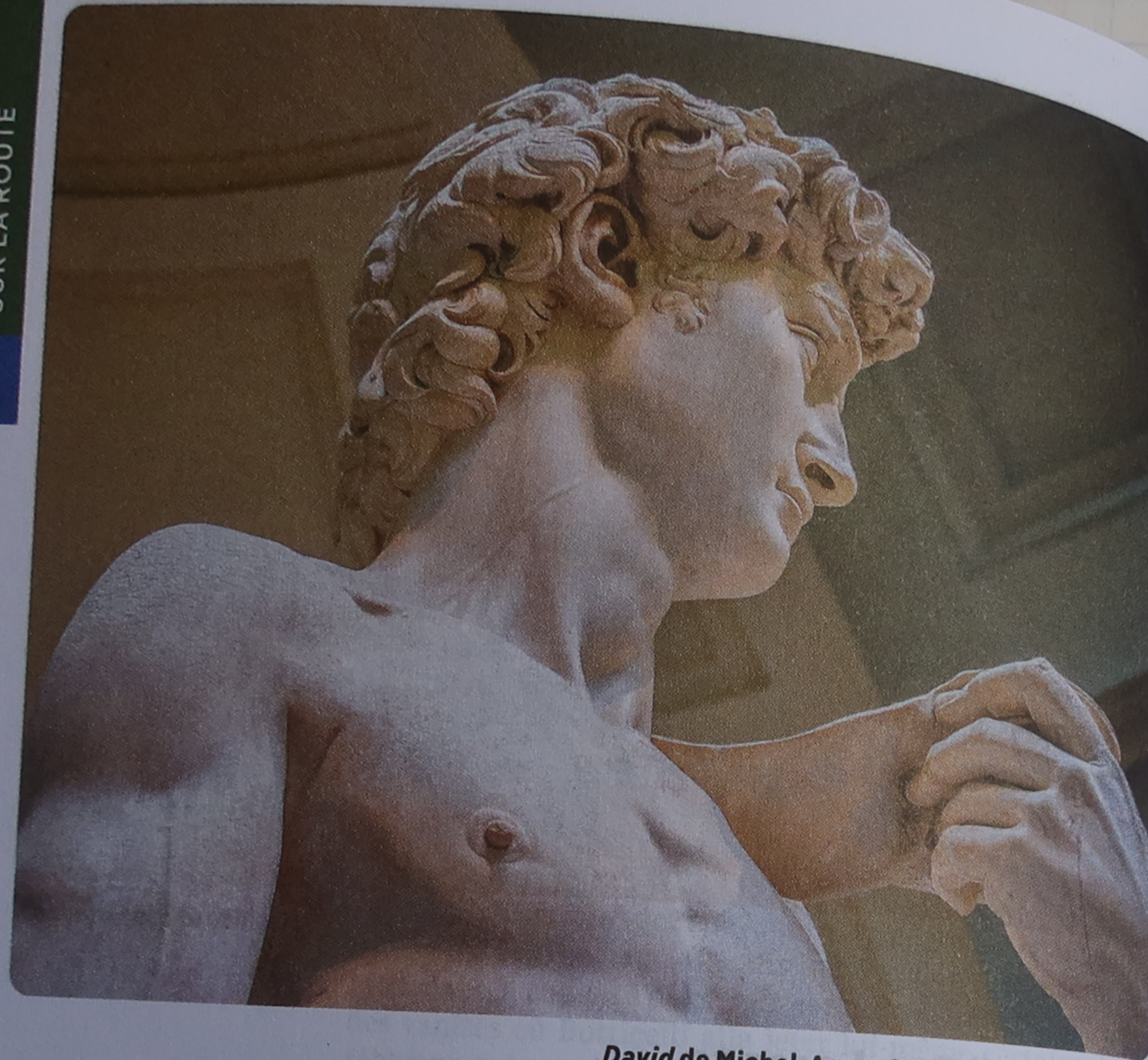
David de Michel-Ange, Galleria dell'Accademia