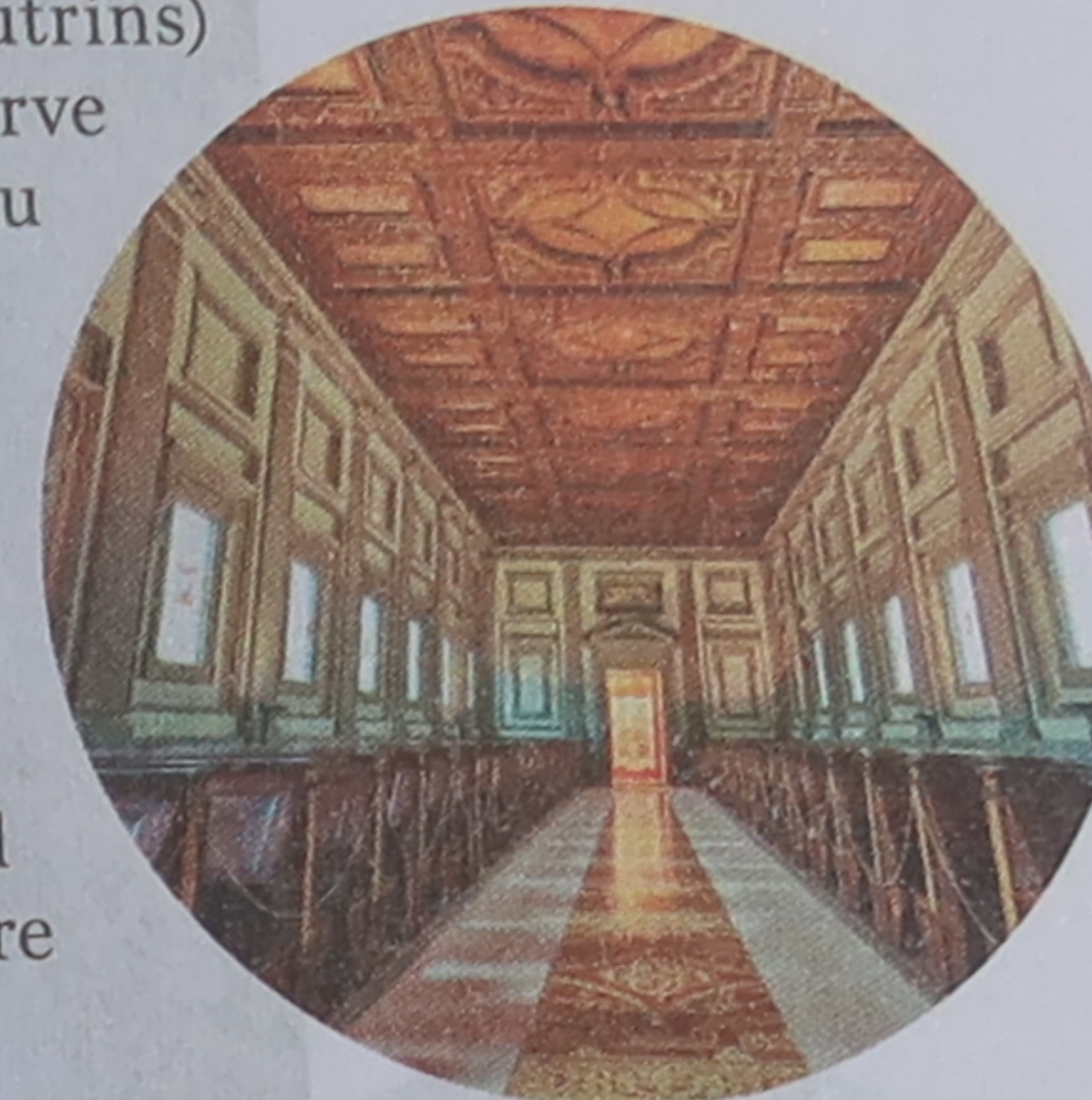
Biblioteca Medicea Laurenziana

Occupant une grande partie de l'ensemble englobant la Basilica di San Lorenzo, la bibliothèque des Médicis fut conçue en 1519 par Michel-Ange, à la demande de Jules de Médicis (futur pape Clément VII), pour abriter une partie de l'immense collection de livres appartenant à sa famille. Par un monumental escalier tripartite, on accède à la salle de lecture, tout en longueur, avec deux rangées de tables inclinées (lutrins) et bancs en bois. La bibliothèque laurentine conserve plus de 11000 manuscrits, 1681 ouvrages originaux du XVI e siècle et la plus grande collection de papyrus égyptiens d'Italie. En particulier le codex unique des Annales de Tacite, les textes autographes de Boccace et un exemplaire de La Divine Comédie manuscrite. L'ensemble témoigne du changement de paradigme culturel vers l'humanisme initié sous Côme l'Ancien, premier homme d'État florentin à comprendre qu'il fallait s'appuyer sur une formation classique pour faire sépanouir une société.