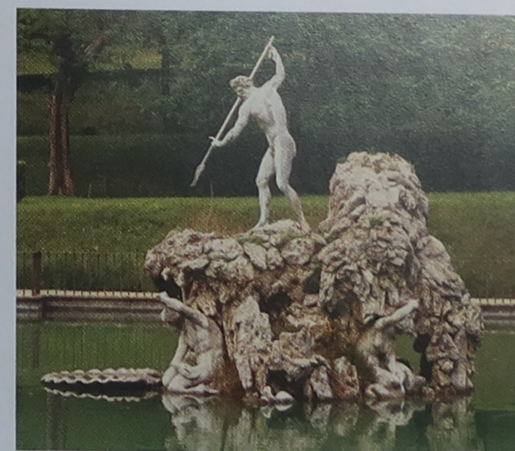
6 ★ Palazzo Pitti Ce palais imposant renferme plusieurs grands musées.