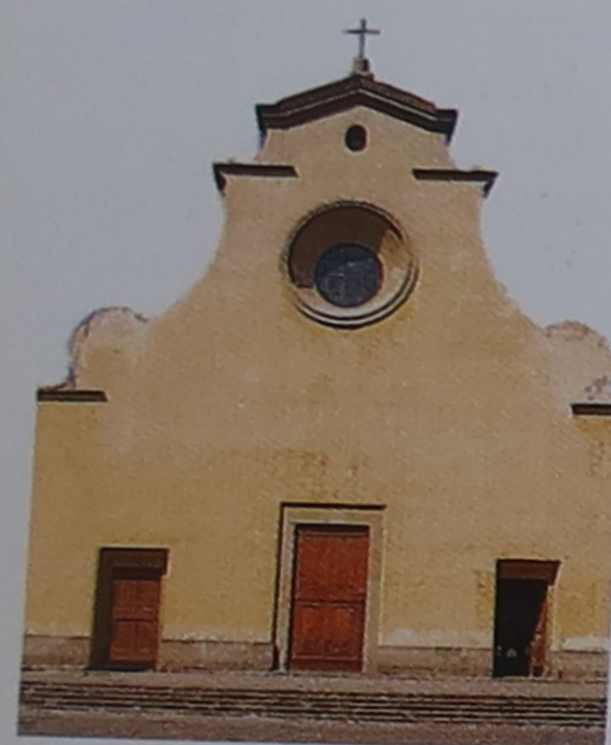
1 Santo Spirito

Un dédale de ruelles bordées de petites maisons et de magasins – qui proposent aussi bien des articles de quincaillerie, que des produits alimentaires et des antiquités – occupe la plus grande partie du quartier. De nombreux ateliers d'artisans s'ouvrent sur ces voies étroites, où les restaurants, restés authentiques, pratiquent des tarifs raisonnables. La via Maggio, bordée de palais imposants, rompt ce maillage de ruelles. La circulation y est incessante, mais il suffit de s'en écarter pour retrouver le calme de la Florence traditionnelle.