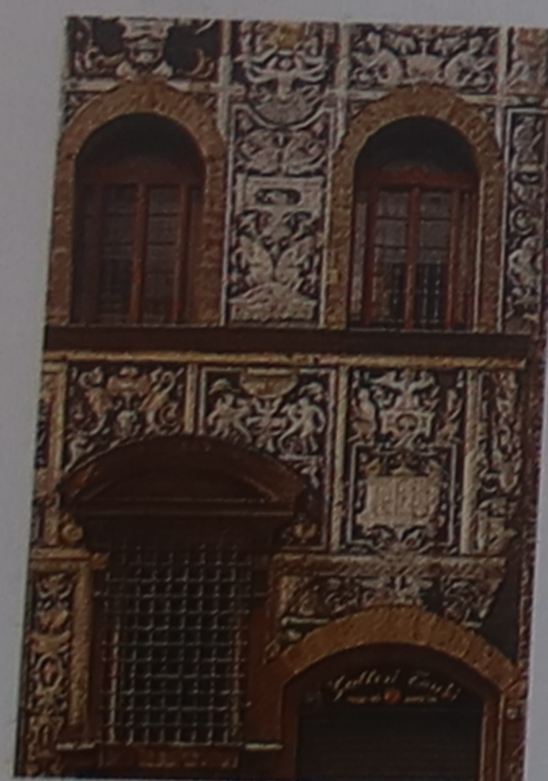
Le palazzo di Bianca Cappello (1566), qu'habita la maîtresse du grand-duc François Ier (p. 55, 58), est orné de nombreux sgraffiti .

Pour les hôtels et les restaurants du quartier, voir p. 254 et p. 267-268