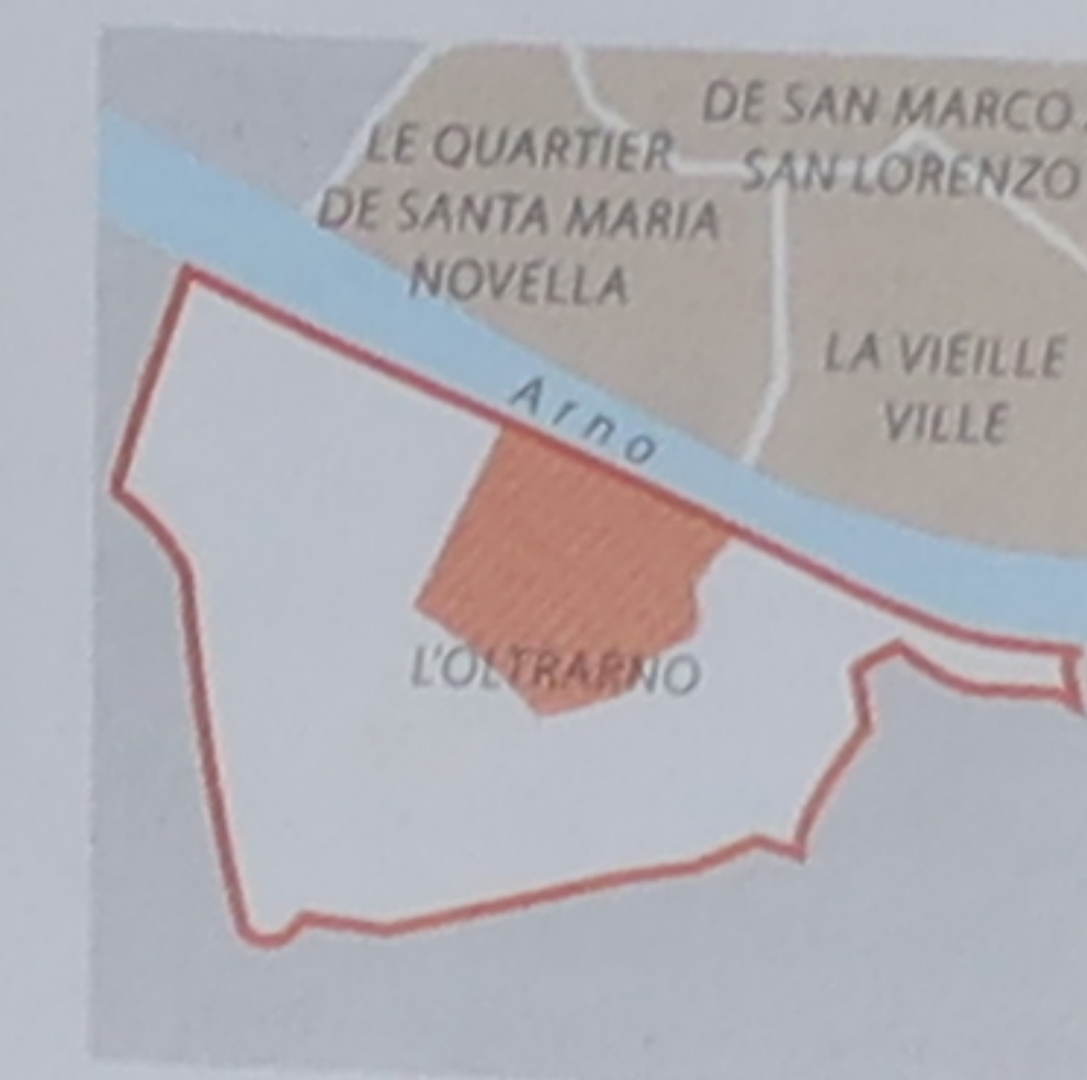
Carte de situation Voir l'Atlas des rues, plan 5