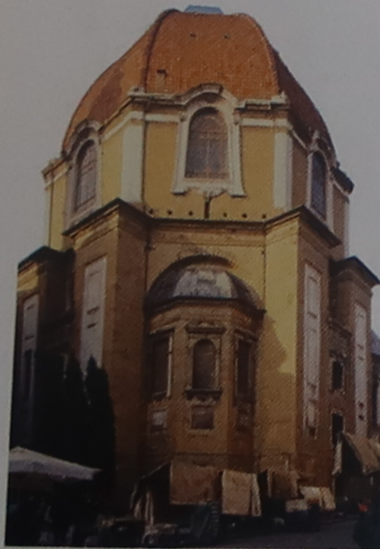
Cappelle Medicee Les chapelles des Médicis font partie de San Lorenzo, mais leur accès s'effectue par une entrée séparée, sur la piazza di Madonna degli Aldobrandini. Michel-Ange a réalisé la Nouvelle Sacristie et les célèbres tombeaux.

Le palazzo Riccardi-Manelli occupe le site de la maison où naquit Giotto di Bondone (v. 1266).