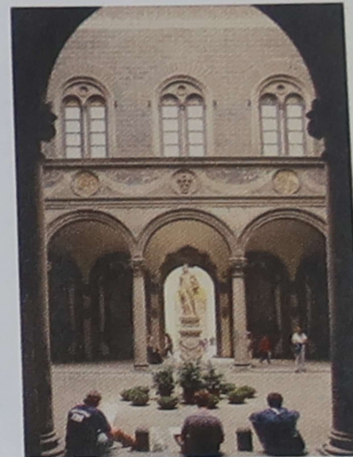
3 Palazzo Pucci La famille du styliste Emilio Pucci résidait dans ce palais.