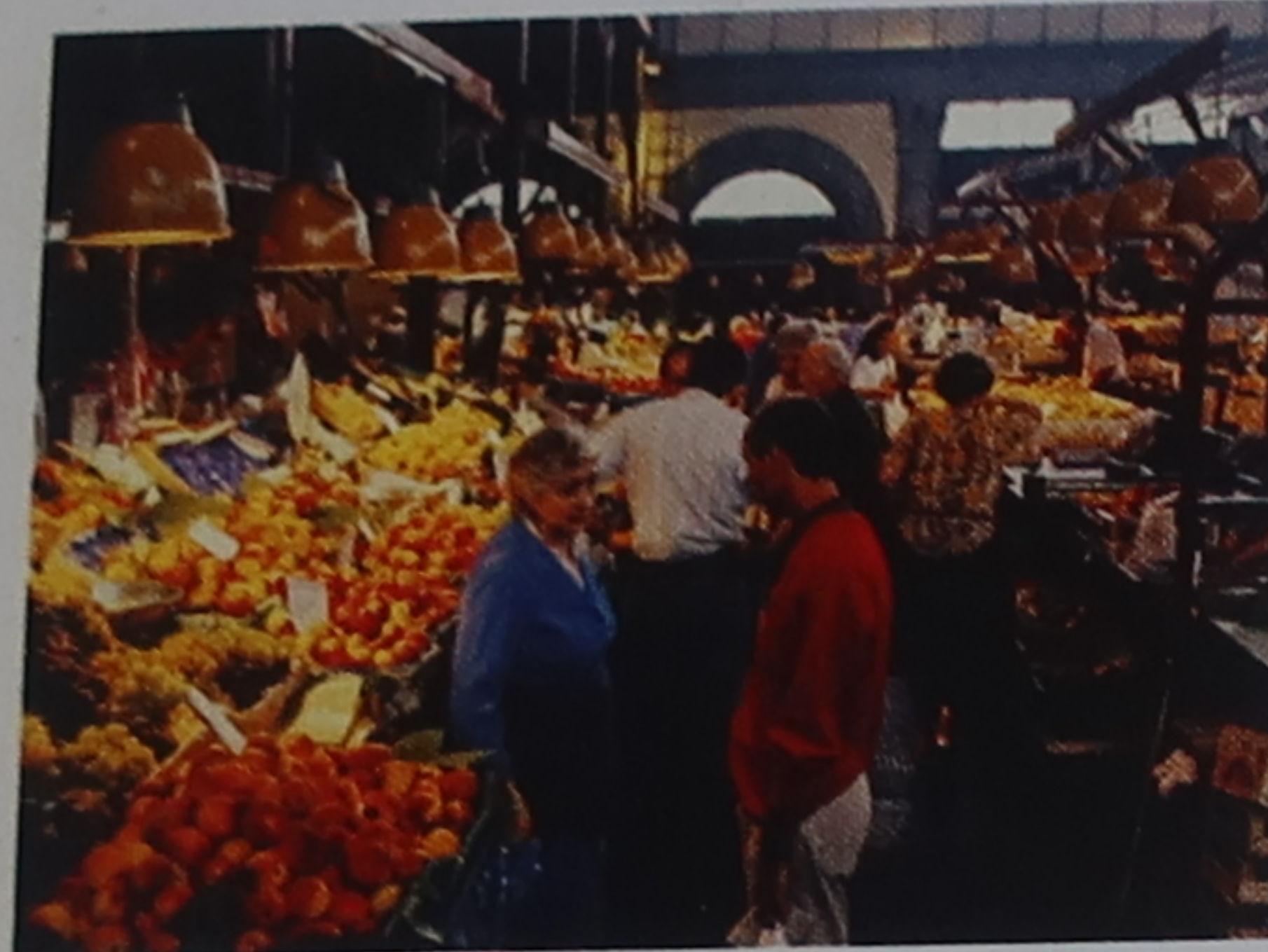
1 Mercato Centrale Bâti en 1874, ce marché couvert propose poissons, viandes et fromages au rez-de-chaussée, ainsi que fruits et légumes à l'étage, sous la verrière.

Deux édifices dominent le quartier : le palazzo Medici-Riccardi, palais des Médicis construit de 1444 à 1464, et San Lorenzo, église commencée en 1424 par Filippo Brunelleschi pour Giovanni da Bicci et à laquelle travailleront les plus grands artistes sous le règne de son fils, Cosme l'Ancien. Un peu partout, en particulier autour du Mercato Centrale, rues et places regorgent d'étals d'articles de cuir, de cachemires, de soieries et de vêtements d'un bon rapport qualité/prix, surtout si l'on est rompu à l'art de la négociation.