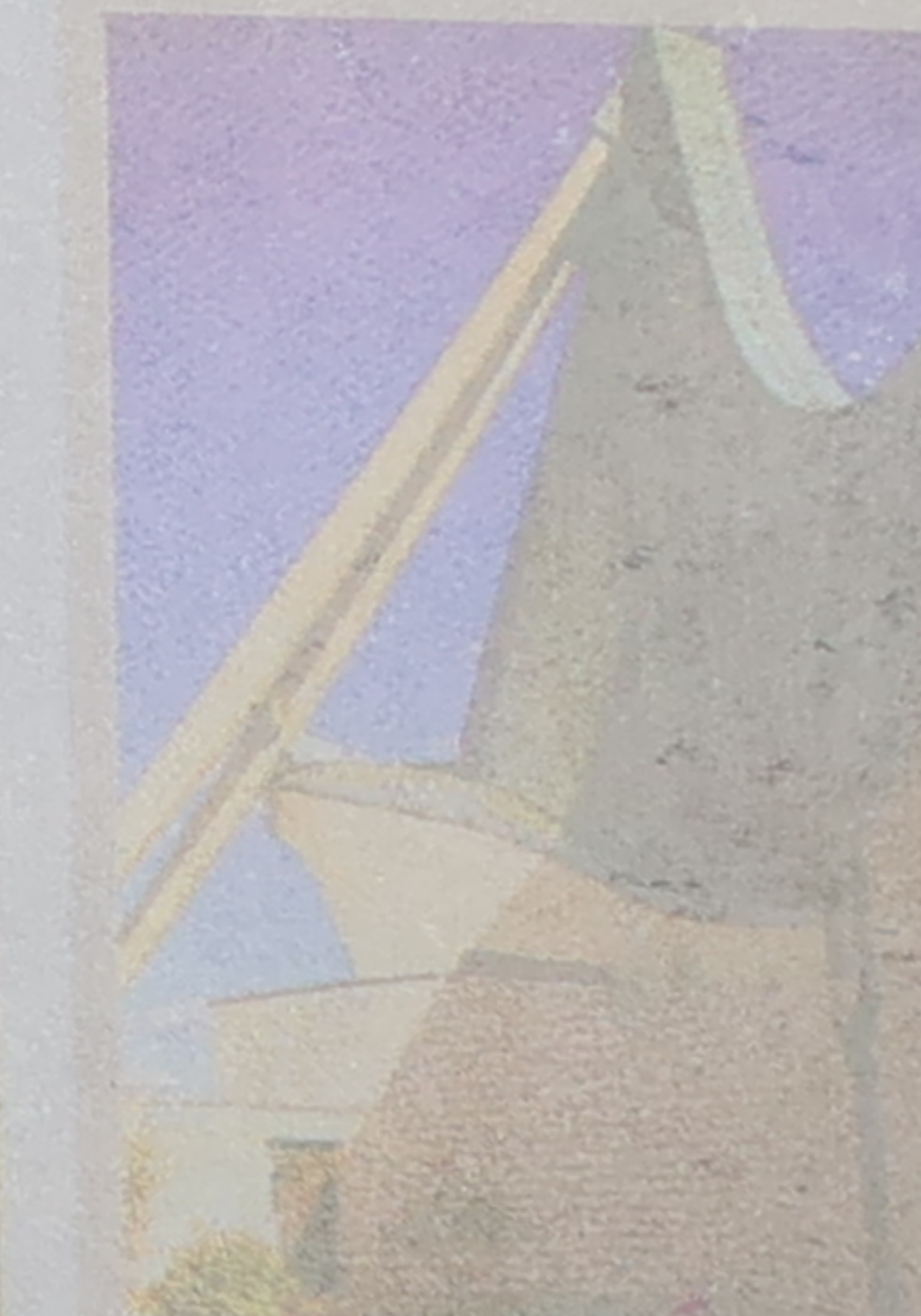
San Giovanni Battista (1964) Giovanni Michelucci éleva son église moderne près de l'aéroport Amerigo-Vespucci.