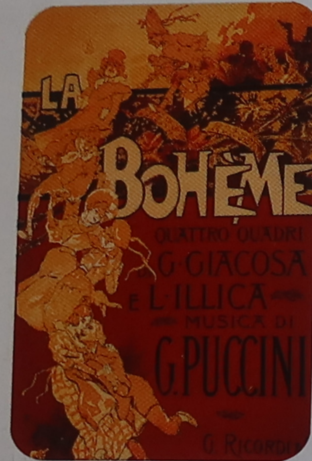
La Bohème (1896) Les festivals de musique de la région (p. 39) mettent souvent à leur programme cet opéra de Puccini, compositeur toscan.

Bien qu'à Florence industries et commerces modernes se soient développés en dehors du centre historique, le xx e siècle a fait peser bien des menaces sur le patrimoine artistique de la cité des Médicis. En dehors du Ponte Vecchio, tous les anciens ponts furent détruits pendant la Seconde Guerre mondiale, puis, en 1966, l'Arno déborda en une crue dévastatrice. Les Florentins ont réagi avec détermination, lançant d'ambitieux programmes de restauration et prenant des mesures énergiques pour lutter contre la pollution, en particulier automobile.