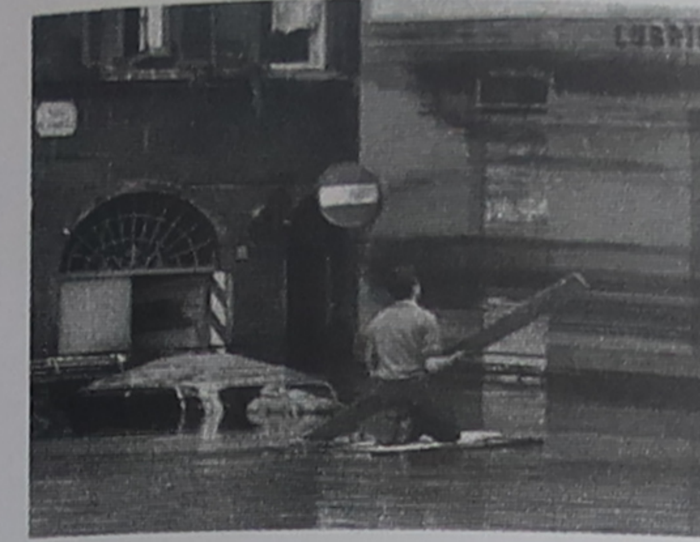
Inondation de 1966 Le 4 novembre, l'Arno dépassa de 6 m le niveau des quais. Le flot boueux endommagea de nombreux trésors artistiques.

En s'installant en périphérie, à Nouvelle Florence, les industries ont préservé la fonction culturelle et touristique du centre.