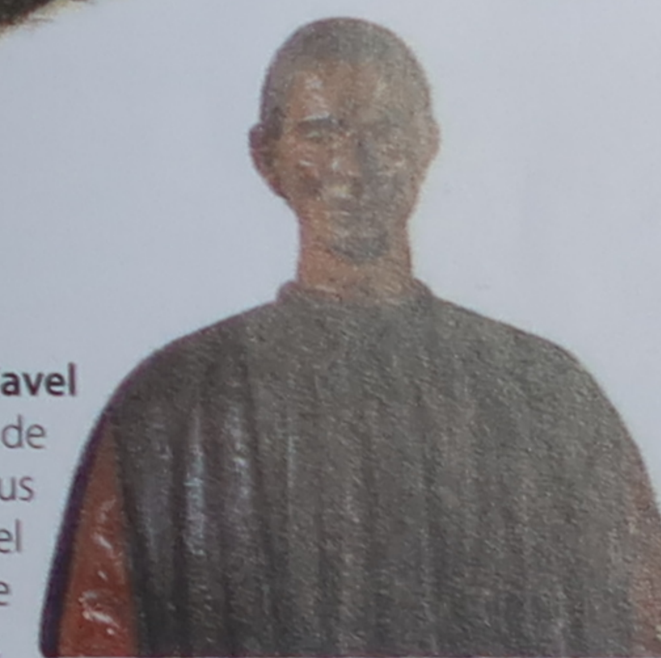
Croquis de Michel-Ange Lors du siège de 1530, Michel-Ange travailla en paix dans les chapelles des Médicis (p. 94-95).

Le Prince , traité sur l'art de gouverner, est l'un des plus célèbres écrits de Machiavel (1469-1527), qui fut secrétaire de la république de Florence.