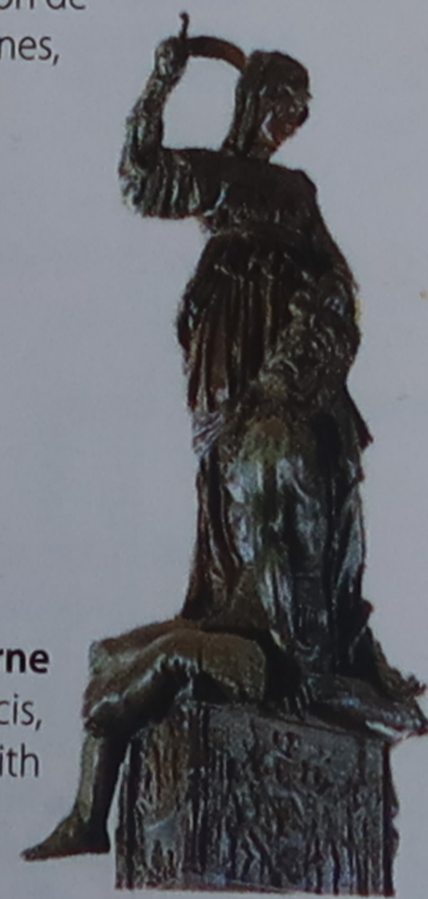
Judith et Holoferne

Quand les Français envahirent les cités toscanes en 1494, Savonarole les accueillit comme les envoyés de Dieu venus punir la passion de ses compatriotes pour les livres profanes, qui méritaient d'après lui l'autodafé.