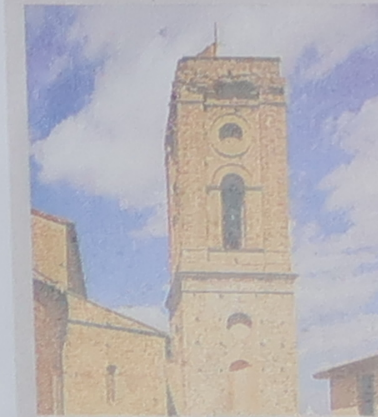
Clocher de San Miniato

Sur la piazza della Signoria (p. 80-81), une plaque indique le lieu où fut exécuté Savonarole ; sa cellule est visible à San Marco (p. 98). Le David de Michel-Ange (p. 100) symbolise la victoire de la jeune République sur la tyrannie. Le Conseil de la République se tenait au salone dei Cinquecento (p. 80).