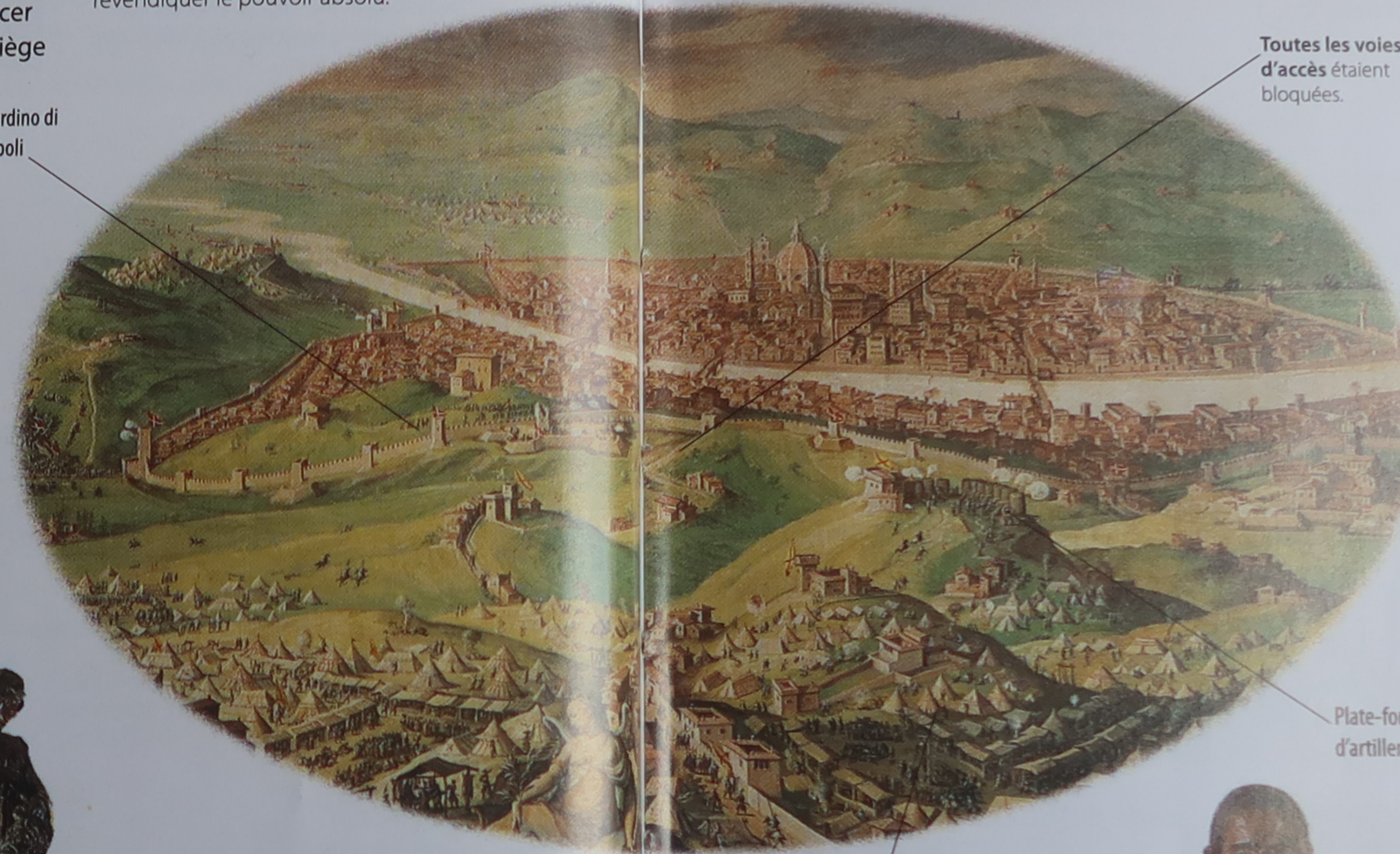
Toutes les voies d'accès étaient bloquées.

Assiégés par 40 000 soldats, levés par le pape et l'empereur, les Florentins ne se rendirent qu'après une résistance héroïque. La fresque de Vasari, que l'on peut admirer au Palazzo Vecchio, montre l'ampleur des défenses et des forces en présence.