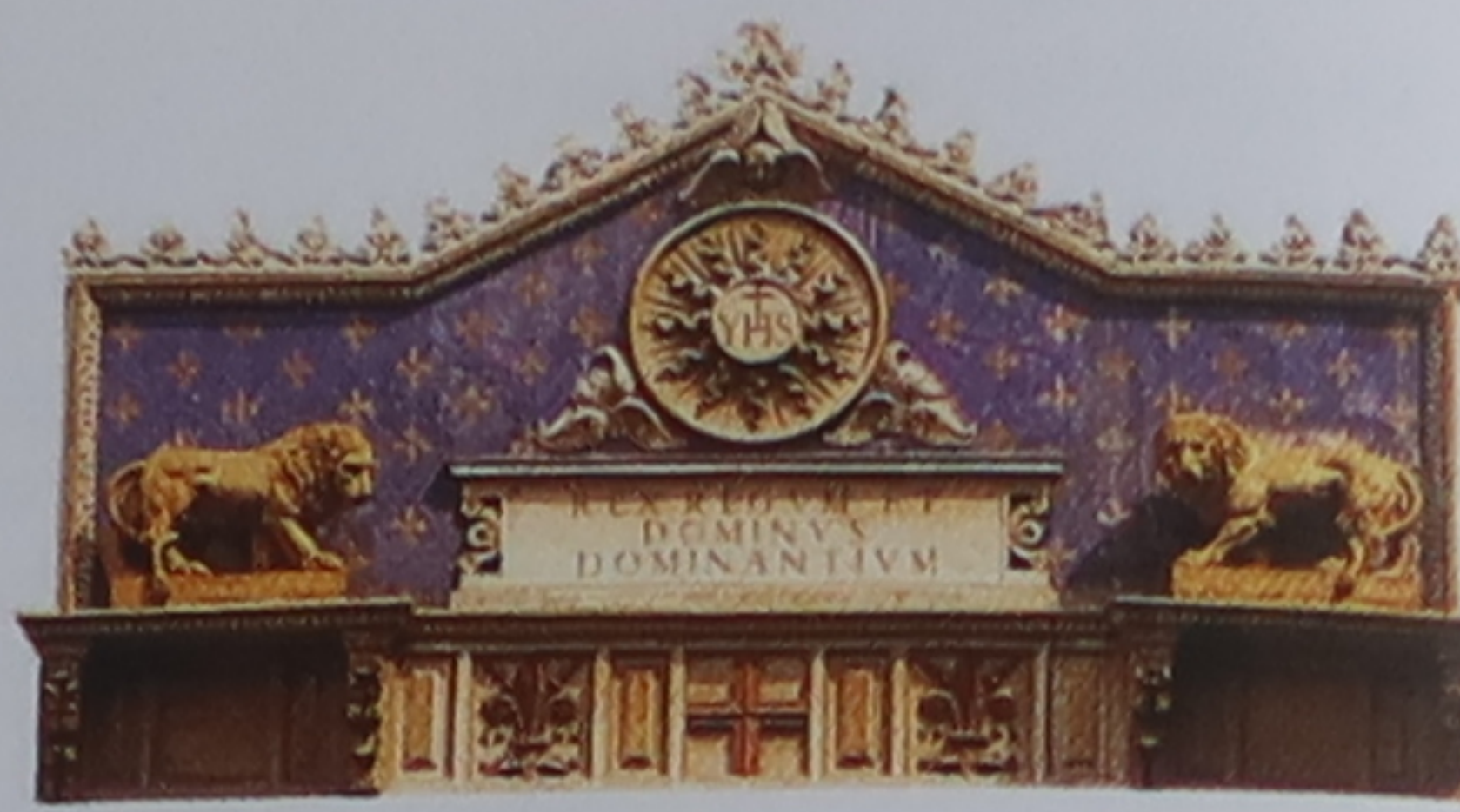
Frise du Palazzo Vecchio L'inscription républicaine « Christ est roi » signifie qu'aucun mortel ne peut revendiquer le pouvoir absolu.

En 1494, après la fuite de Pierre de Médicis devant les troupes françaises de Charles VIII, le prêtre dominicain Jérôme Savonarole fonde à Florence une république de « la vertu ». Ce prédicateur et réformateur italien finit par être excommunié, ayant lassé le peuple par ses excès. Il est exécuté en 1498, mais la République se maintient jusqu'en 1512. Elle renaît de 1527 jusqu'à 1530, où le pape Clément VII (un Médicis) et l'empereur Charles Quint s'allient pour placer au pouvoir un Médicis, Alexandre, après un siège de la ville qui dura dix mois.