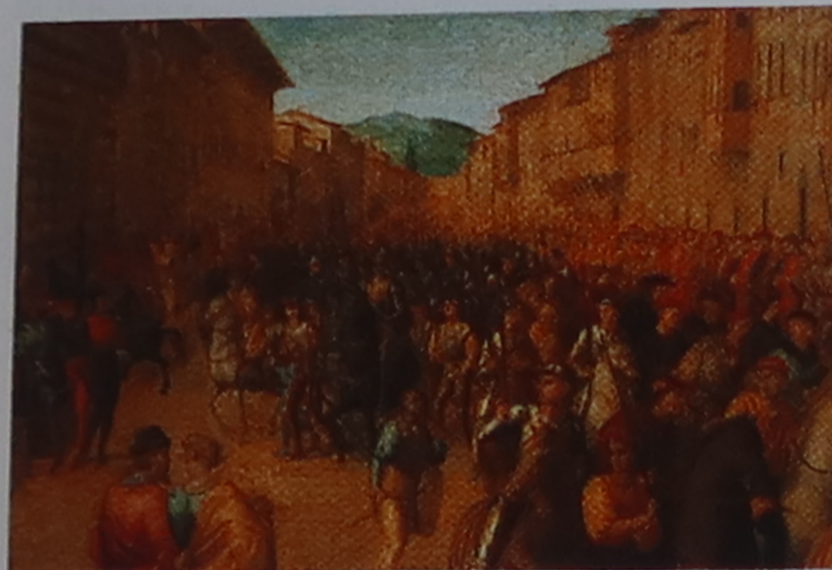
Charles VIII entre à Sienne

Quand les Français envahirent les cités toscanes en 1494, Savonarole les accueillit comme les envoyés de Dieu venus punir la passion de ses compatriotes pour les livres profanes, qui méritaient d'après lui l'autodafé.