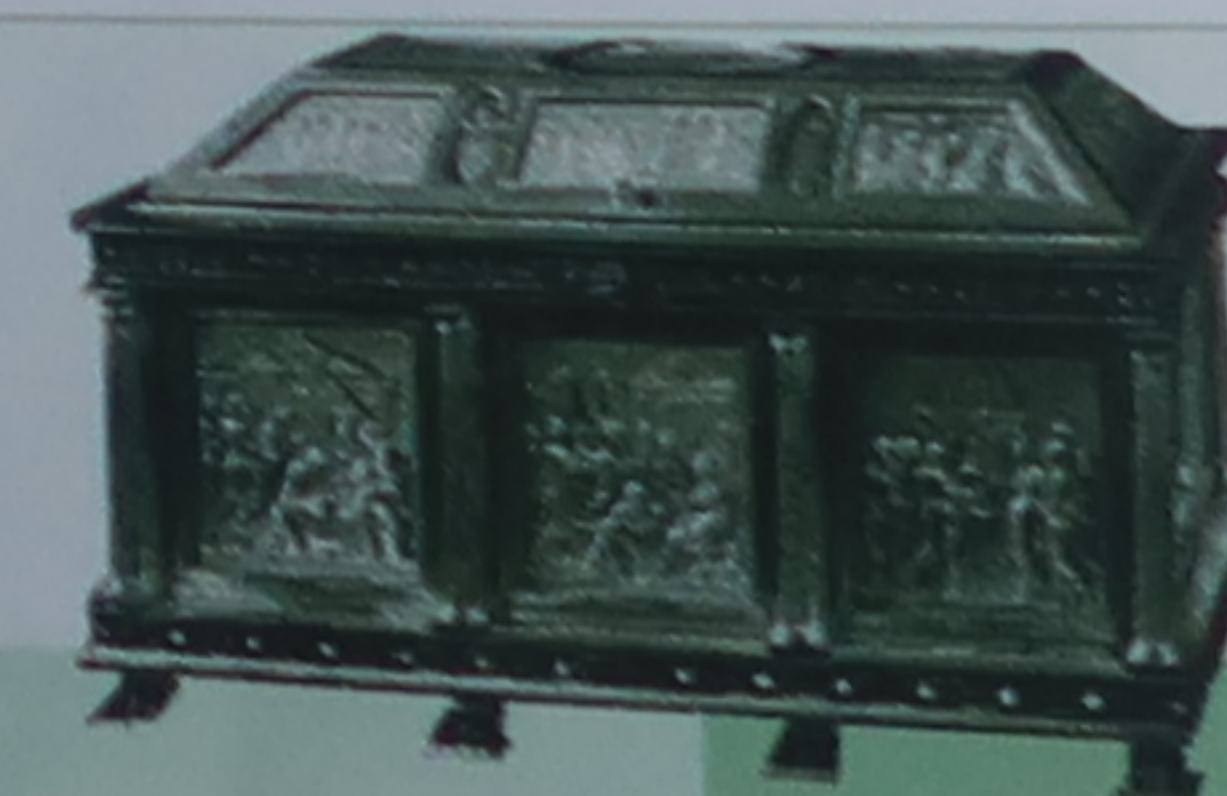
Coffret en cristal du pape Clément VII

1520 Michel-Ange commence la réalisation des tombeaux des Médicis (p. 95)