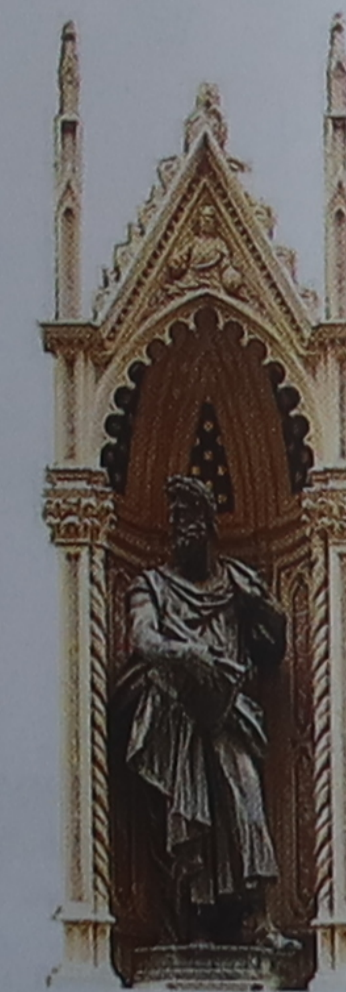
Saint Luc, Orsanmichele