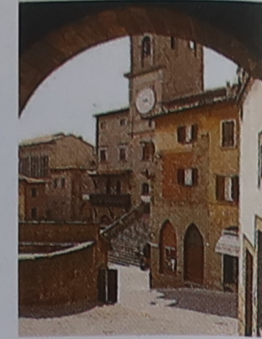
Palais gothique, Cortone

Le charme de la Toscane émane en partie du nombre d'édifices gothiques et Renaissance qui y ont subsisté. Des rues entières, comme dans le quartier du Mercato Nuovo à Florence, des places, telles que la piazza dei Priori à Volterra (p. 171), et même des villes, à l'image de San Gimignano, sont restées quasiment intactes depuis le xv e siècle. Quelques indices (par exemple, la forme des fenêtres) révèlent le style des bâtiments et l'époque de leur construction.