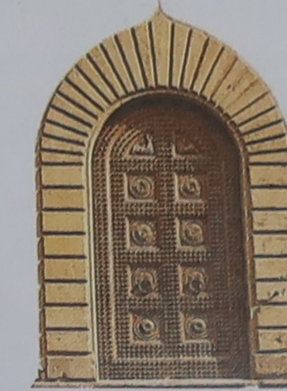
Arc à clé de voûte ornementale

C'est la simplicité des édifices de la Rome classique qui inspira Brunelleschi lorsqu'il dessina la loggia du spedale degli Innocenti (1419-1424) à Florence (p. 101), tenue pour sa première œuvre architecturale Renaissance. Ses concitoyens embrassèrent avec enthousiasme ce style élégant, considérant leur ville comme la « nouvelle » Rome.