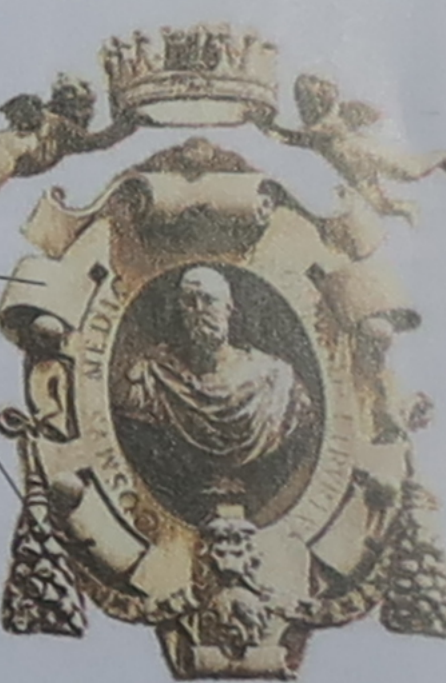
Cartouche orné de volutes et de guirlandes

Les entourages de fenêtres sont très ouvragés.