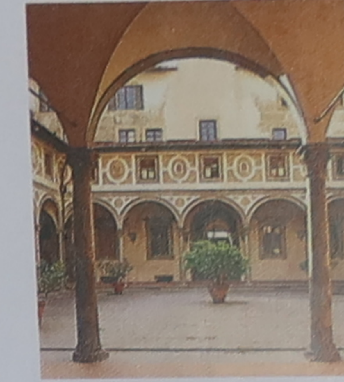
Cour du spedale degli Innocenti

Les corniches s'inspirent de l'architecture antique.