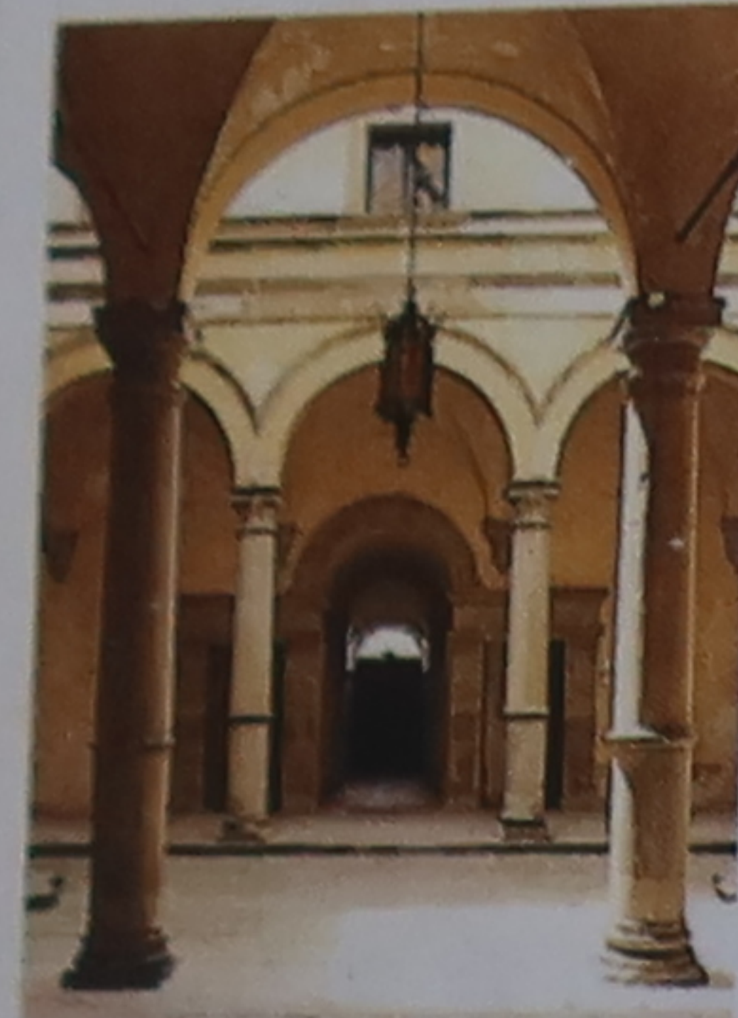
Cortile On accueillait jadis les visiteurs dans le cortile, cour intérieure entourée d'arcades et protégée des regards indiscrets à l'entrée du palais.