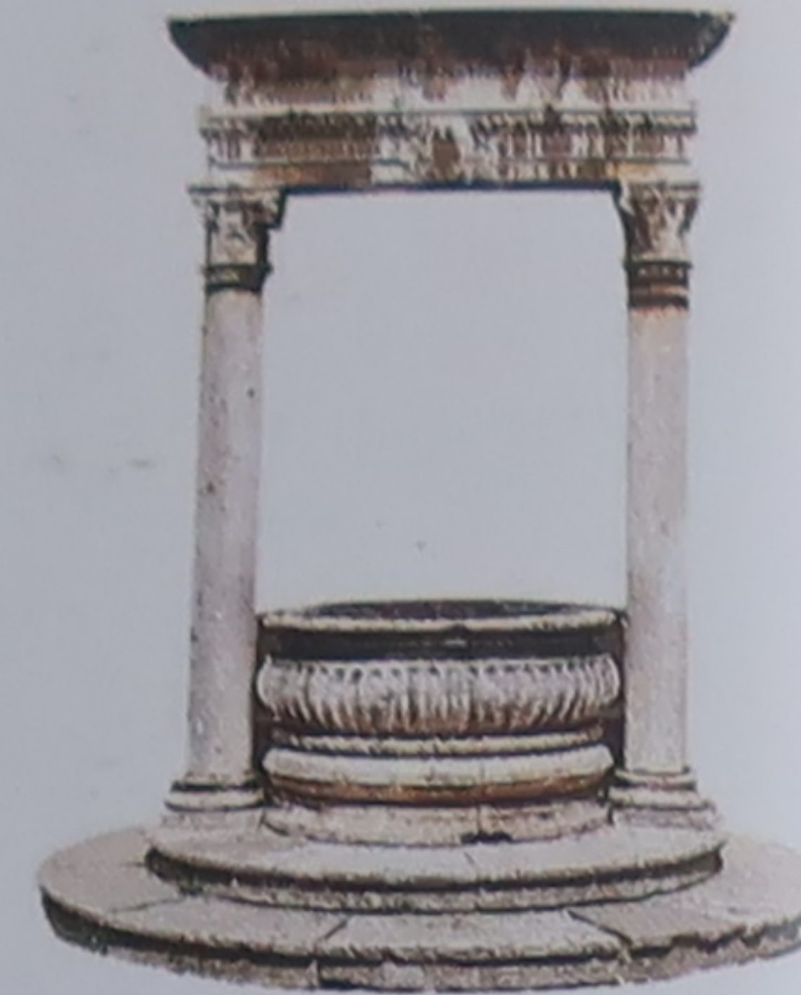
Puits Des lois très strictes régissaient l'usage de l'eau, une ressource précieuse.

La vie d'une cité toscane s'organise autour de sa grand-place, ou piazza. C'est là que se tiennent les fêtes traditionnelles et que l'on se retrouve aux alentours de 18 h ou 19 h pour la traditionnelle passaggiata , la promenade du soir. En règle générale, les bâtiments importants de la vie publique, laïques ou religieux, entourent la piazza. Ces édifices présentent pour la plupart des éléments caractéristiques, comme le campanile, le cortile ou la loggia, consacrés chacun à un usage spécifique. Vous vous apercevrez qu'aujourd'hui encore ces bâtiments continuent souvent à remplir les fonctions pour lesquelles ils furent édifiés entre le XIII e et le XVI e siècle.