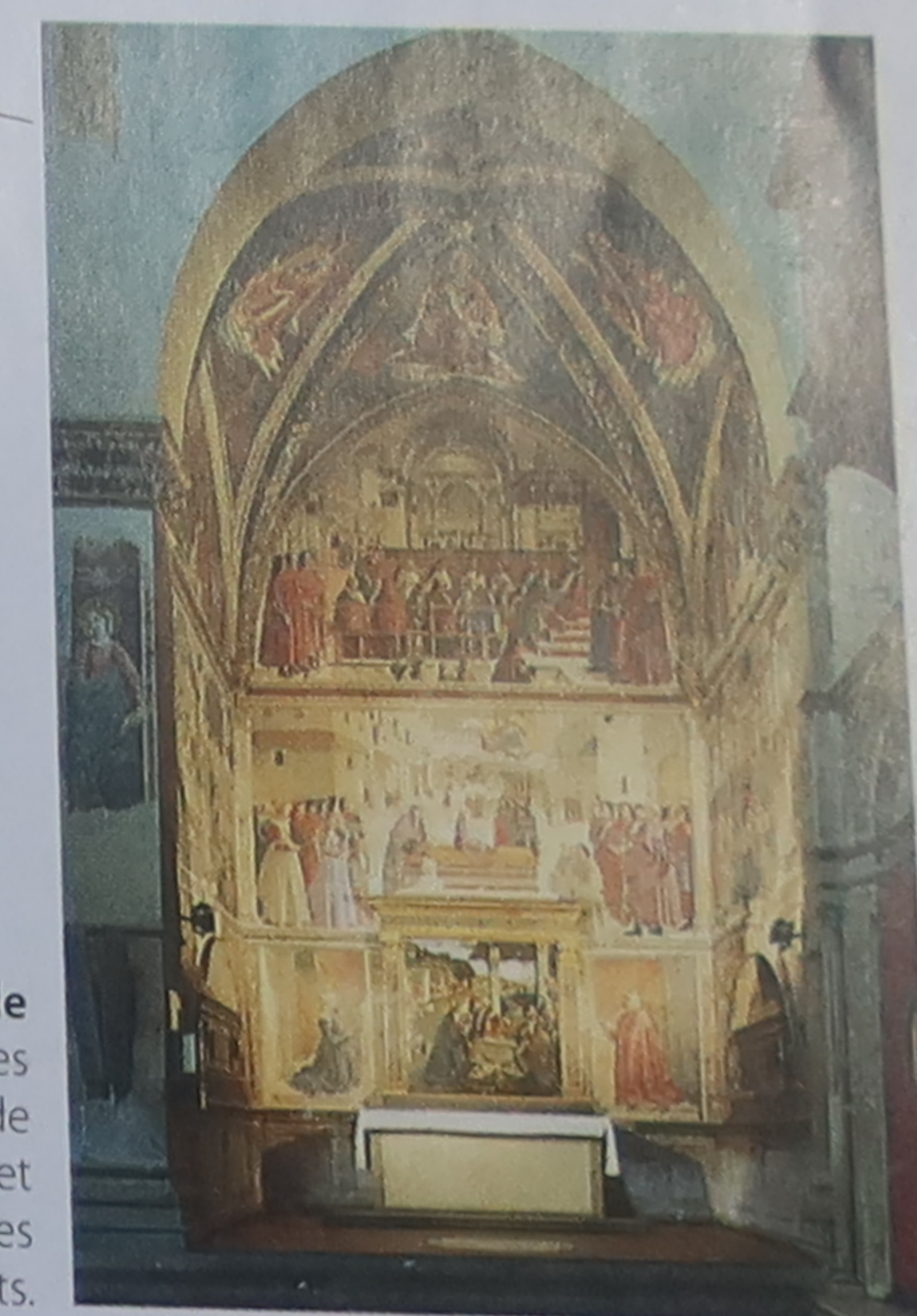
Chapelle latérale Les familles riches faisaient décorer de fresques, de peintures et de tombeaux les chapelles dédiées à leurs morts.