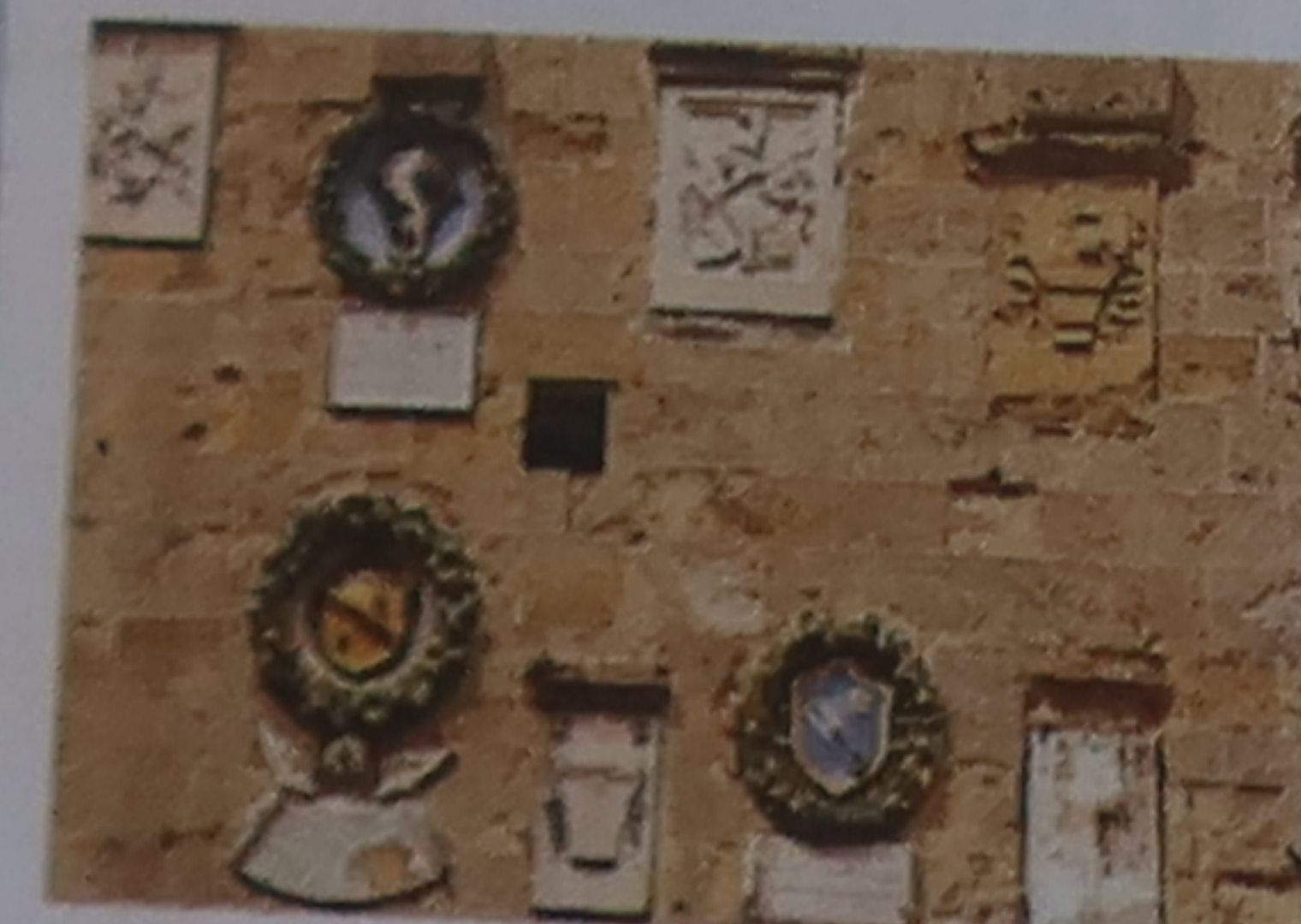
Blasons Beaucoup d'édifices publics arborent sur leurs façades les armoiries sculptées d'anciens magistrats ou conseillers.