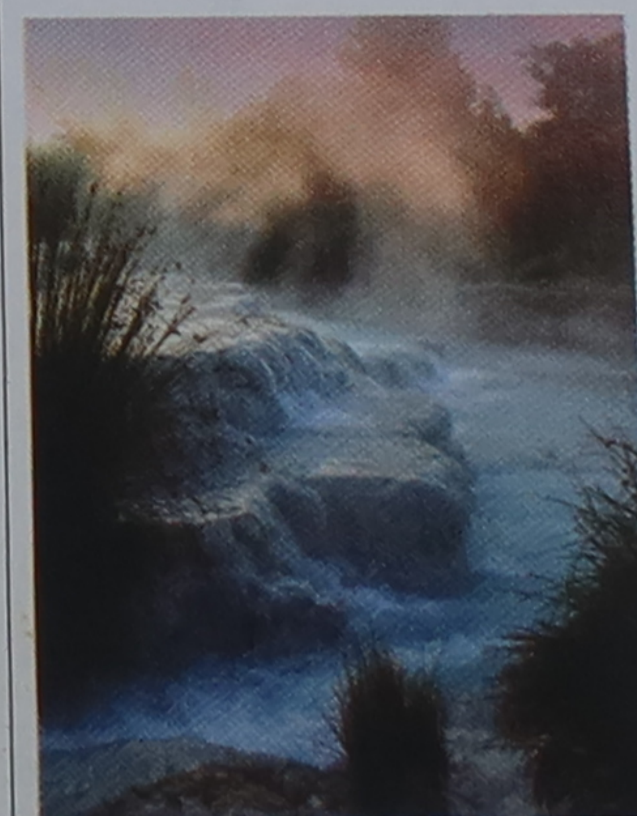
Chutes et bassins d'eau thermale, cascade del Gorello, Saturnia

Capalbio (p. 245), bourg perché aux fortifications crénelées, est une villégiature d'été appréciée de l'intelligentsia de gauche. Il possède d'excellents restaurants. Prévoyez donc d'y arriver pour le déjeuner, puis arpentez ses rues pittoresques avant de rejoindre le giardino dei Tarocchi . L'artiste française Niki de Saint Phalle y a créé d'imposantes sculptures colorées sur le thème du tarot. Reprenez la voiture pour vous rendre au monte Argentario (p. 244), promontoire rocheux relié à la côte par des chaussées. Ses deux principales localités, l'élégant Porto Ercole et le Porto Santo Stefano (plus modeste), partagent la même réputation pour leurs bons restaurants de poisson. Installez-vous sur le port pour contempler les nombreux navires de plaisance.