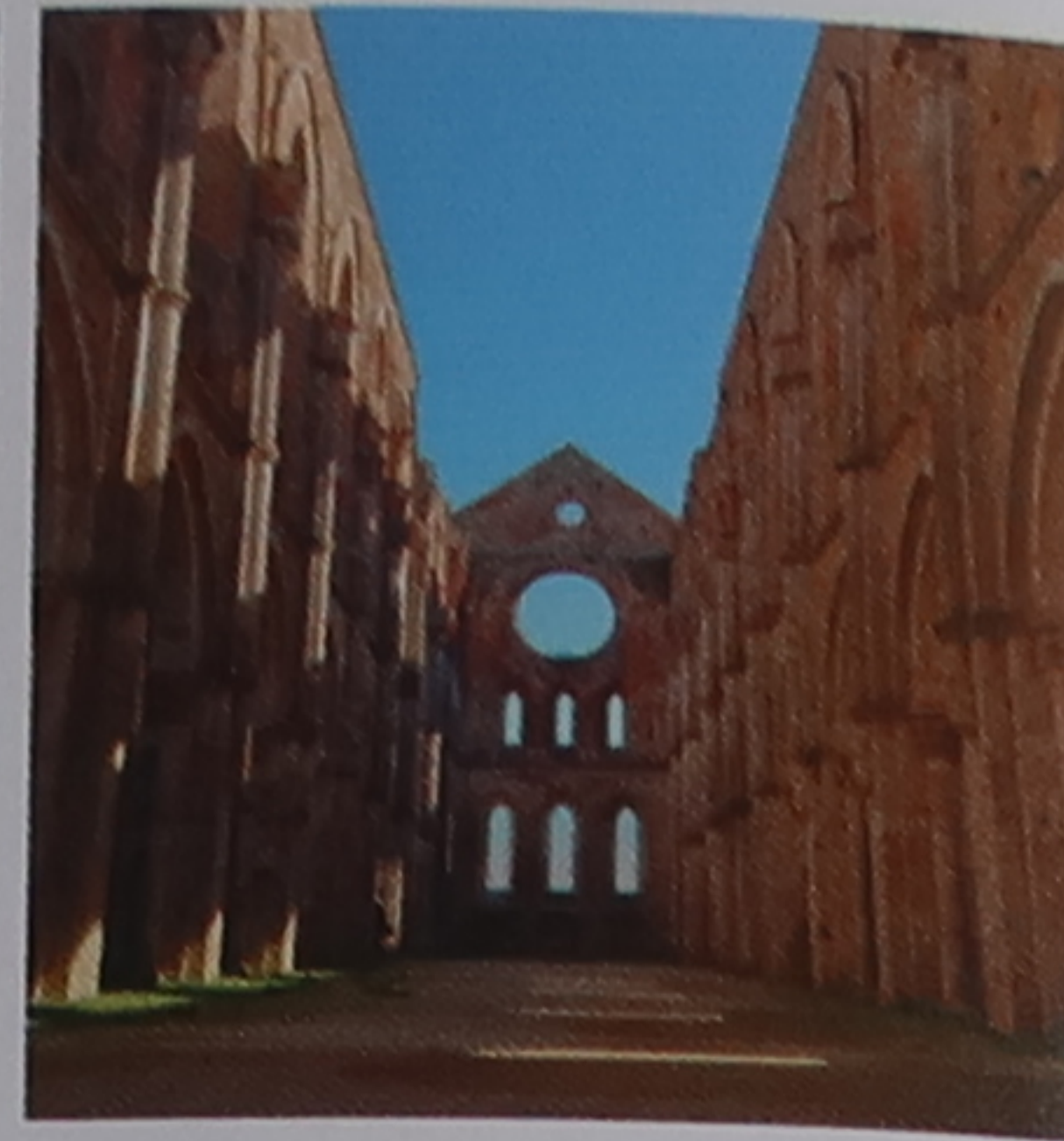
La nef en ruine de l'élégante abbaye cistercienne de San Galgano

l'espoir de faire de son lieu de naissance une cité modèle. Déjeunez à Montepulciano (p. 231), réputé pour ses vini nobile , avant de franchir le val d'Orcia pour passer la nuit à Montalcino (p. 228-229). Ce bourg médiéval produit le grand cru brunello di Montalcino (p. 262).