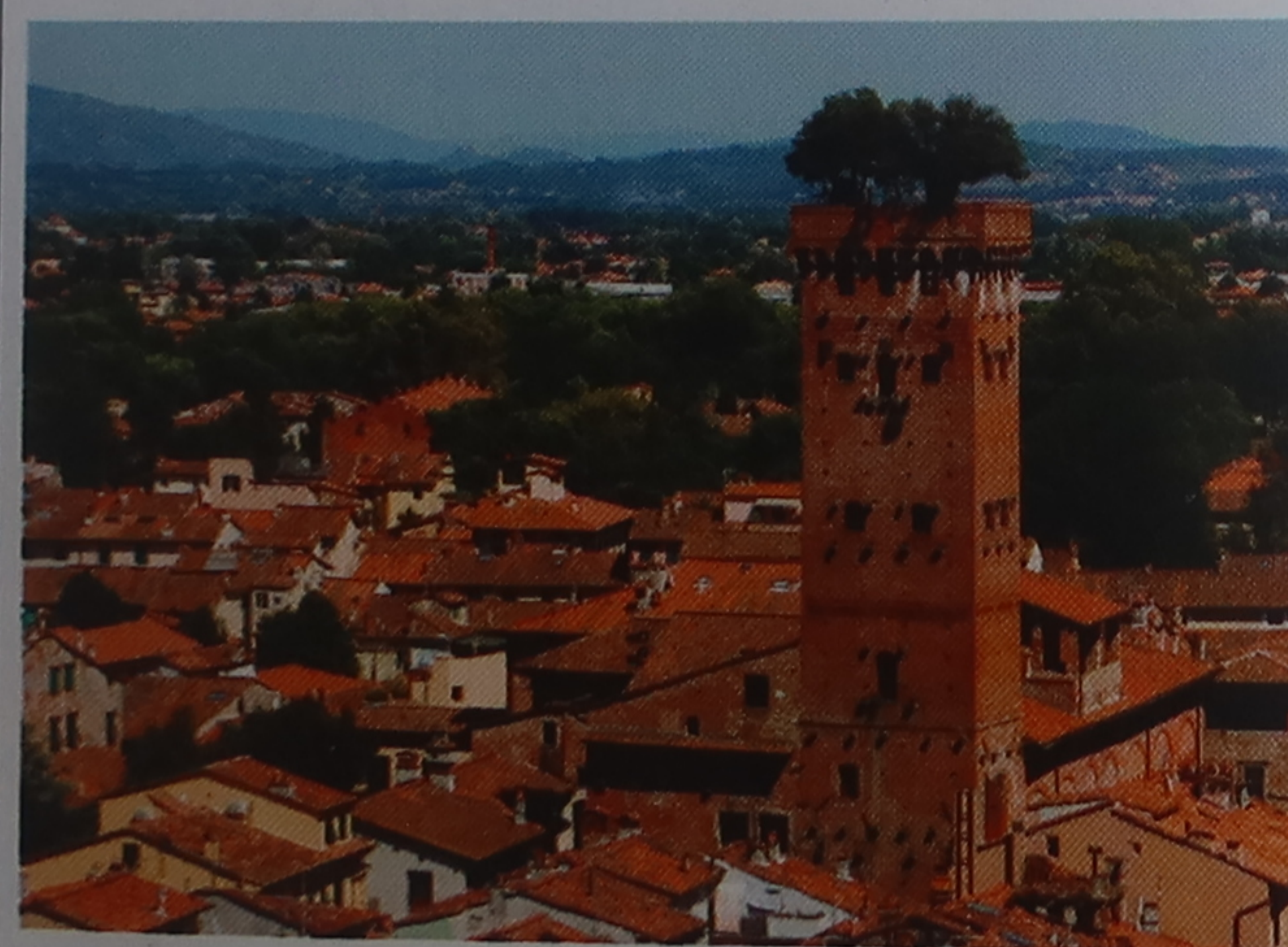
La torre dei Guinigi et son jardin sur toit, Lucques

Quittez la ville de Sienne par la route d'Asciano qui traverse les curieux reliefs d'argile baptisés Crete (p. 36). Faites étape au joli village assoupi de Pienza (p. 230) pour son centre Renaissance. Il fut créé par le pape Pie II dans